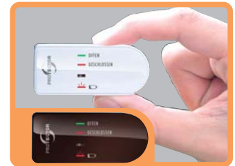
FENSTER SENDEGERÄHE ZUSÄTZLICH IN BRAUN BEIGEFÜGT