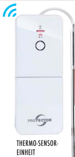
THERMO-SENSOR-EINHEIT FÜR OFENROHR