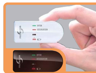
FENSTER SENDERGEHÄUSE ZUSÄTZLICH